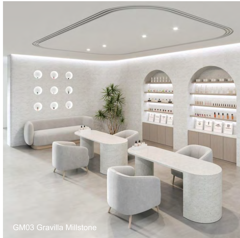
GM03 Gravilla Millstone

Gravilla Millstone mengt een neutrale kleurtextuur met lage chromatische grijstinten voor een lichte en ruime uitstraling, perfect voor ruimtes die gebrek hebben aan natuurlijk licht of om een donker palet te verheffen. Het werkt vooral goed in winkels en bedrijfspanden met zijn frisse, moderne uitstraling die een luxe uitstraling geeft aan elk interieur.