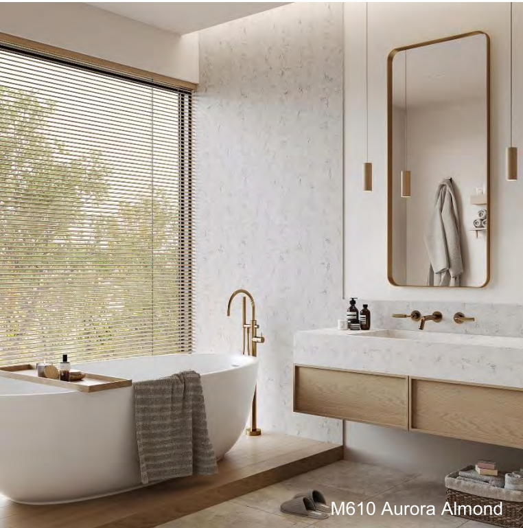
M610 Aurora Almond

Aurora Almond is een warme en rustgevende tint, perfect om een verfijnde uitstraling toe te voegen aan eigentijdse en klassieke ruimtes. De beige en bruine geaderde details voegen tonale elementen toe aan een neutrale achtergrond, wat resulteert in een verfijnde esthetiek met een glad, tastbaar gevoel. Een ideaal oppervlak voor keukeneilanden en spatwanden.