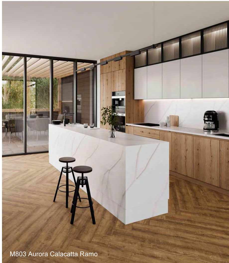
M803 Aurora Calacatta Ramo

menkt elegantie en moderniteit, geïnspireerd door de natuurlijke schoonheid van Calacatta-marmer en vermengt het met warme bruine aderen op een gladde witte basis. Met een vrij stromende, organische uitstraling is deze kleurideaal voor grote oppervlakte-toepassingen zoals receptiebalies, bekleding van eilanden, werkbladen en badkamerwanden en -vloeren.