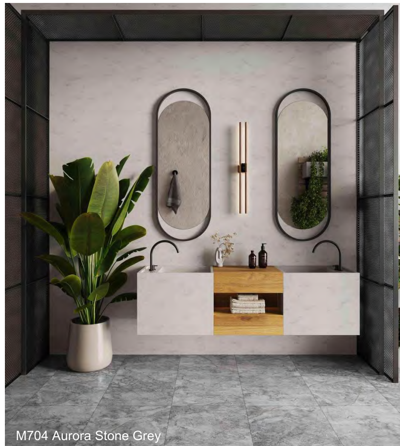
M704 Aurora Stone Grey

Aurora Stone Grey is een koele, eigentijdse ontwerp dat elegantie en verfijning uitstraalt. Een ideaal oppervlak voor minimalistische badkamers en natte ruimtes, het strakke ontwerp kenmerkt ingetogen steengrijze tinten met subtiele wolkachtige patronen voor een 'bijna niet zichtbare' uitstraling en gevoel die uitstekend werkt met matte zwarte accenten.