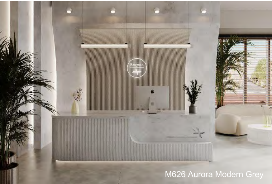
M626 Aurora Modern Grey

Aurora Modern Grey is strak en modern met zijn eigentijdse esthetiek, waardoor het diverse ontwerpstijlen en accenten van koele of gedurfde kleuren kan aanvullen. Als perfect neutrale achtergrond brengt deze veelzijdige tint verfijning en elegantie in retailruimtes, de horecasector, bedrijven en commerciële panden.