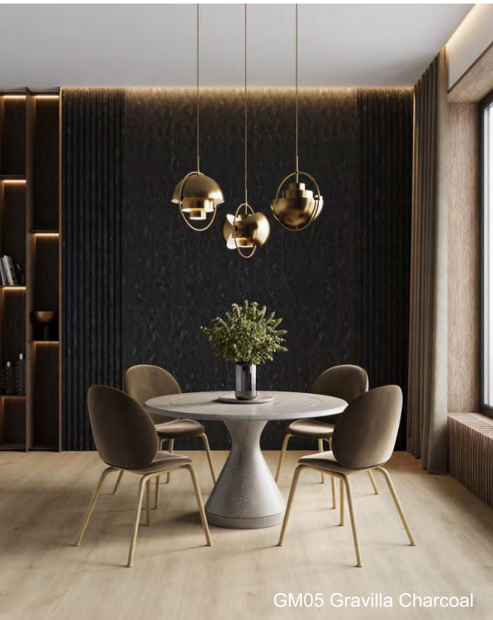
GM05 Gravilla Charcoal

Gravilla Charcoal brengt diepte en een dramatische afwerking naar residentiële projecten, evenals naar de horecasector en spa's. Modern en verfijnd, zijn verfijnde en luxueuze uitstraling combineert houtskool- en zwarte tinten om te boeien en te betoveren, en het ziet er prachtig uit in combinatie met metalen accenten in geborsteld goud of gebrand messing.